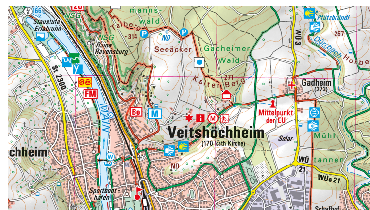
Ausschnitt aus UK50-7 Fränkisches Weinland

Kulturinteressierte empfehlen sich die Sommerresidenzen der Würzburger Fürstbischöfe sowie die Barockschlösser Werneck und Veitshöchheim (samt Rokoko-Garten). „Willkommen an Bord“ heißt es auf den regelmäßig verkehrenden Mainfähren in Würzburg und Gemünden a.Main. Wer mit Kindern unterwegs ist kann dem Tierpark Sommerhausen oder dem Hochseilgarten Frankenturm einen Besuch abstatten. Erholung oder Spaß im Nassen findet man im Erlebnisbad Nautiland in Würzburg.